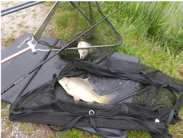
Die zwei die sich zugleich anstellten

Dienstag Mittwoch und Donnerstag biss einer nach dem Anderen, einmal hatte ich sogar 2 Bisse zugleich und musste mich entscheiden welcher ein wenig warten musste zur Landung...beide hatte ich dann doch erwischt!