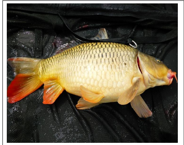
Ein schöner Karpfen mit 4,10 Kg

Auch dieser Tag war kein besonderer Fischtag, ich denke die Fische feierten auch Ostern und hatten keine Fress Party am Hacken vor, daher auch keine großer Fang